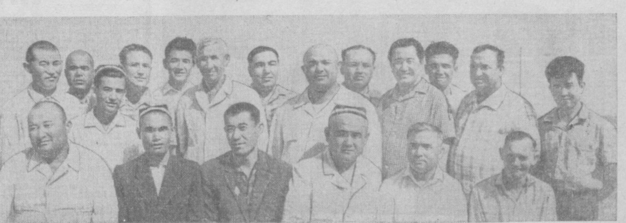
Суратда: Сирдарё область узаро-техник рив бригадасининг аъзолари.