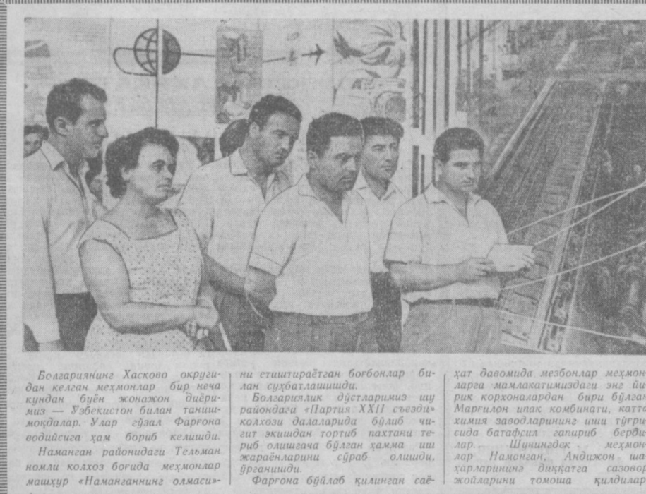
Болгариянинг Хасково округидан келган меҳмонлар бир неча кундан бери жомон дўстларимиз — Ўзбекистон билан танишмоқдалар. Улар сўзла Фарғона водийсига ҳам бориб келишди. Наманган районидан Тельман номи қолхоз боғида меҳмонлар моҳир «Наманганнинг оламси» ни етиштирган боғбонлар билан сўбатлашмоқда.