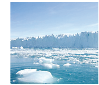
Хитой фанлар академияси маълумотларига кўра, кейинги 50 йилда музликда харо-

Миллионлаб кишиларни обихаёт билан таъминлайдиган Тибет музликларидеги сўнгги икки мингйилликдаги энг юқори харорат кузатилмоқда.