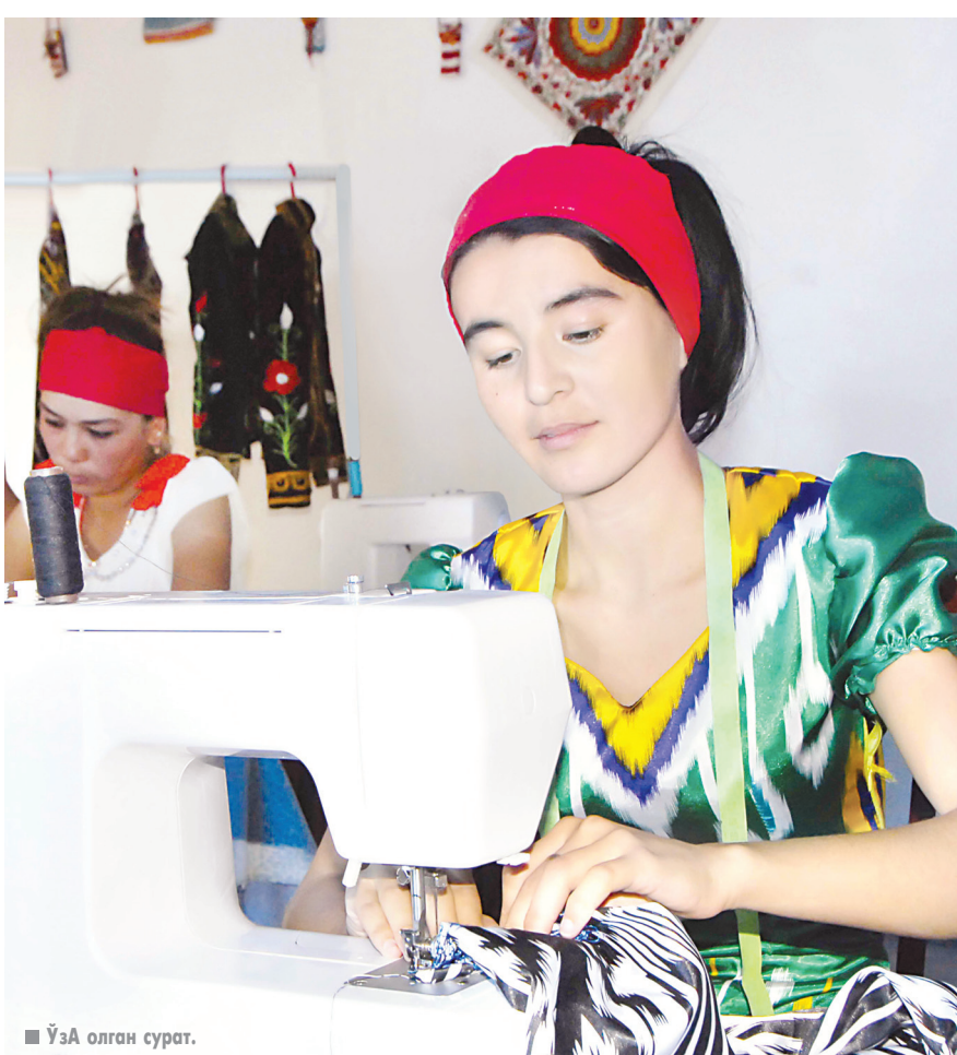
Уйа олган сурат.

«Маҳалла» хайрия жамоат фонди туман бўлимаси ЎзЛиДеП Кармана тумани бўлими билан ҳамкорликда ҳудуддаги маҳалла фуқаролар йиғинлари ҳузурда «Маслаҳат марказлари»ни ташкил этиб, уларга услубий ва амалий жиҳатдан қўмаклашадиган бўлди. Республикаимизнинг барча маҳаллаларидаги сингари янги марказлар тадбиркорлик ғояларини тарғиб қилади, ўз бизнесини йўлга қўйиш ниятидаги шахсларга ахборот-ҳуқуқий маслаҳатлар беради. Бундан ташқари, ҳудудда