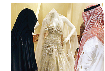
Саудиялик эркакларнинг Чад, Покистон, Мьянма ва Бангладеш фуқароларига уйланиш тақиқланди. Бойси мазкур мамлакатлардан келиб

Саудия Арабистони ҳукумати хорижлик аёлларга уйланиш бўйича қатор чекловларни жорий қилди.