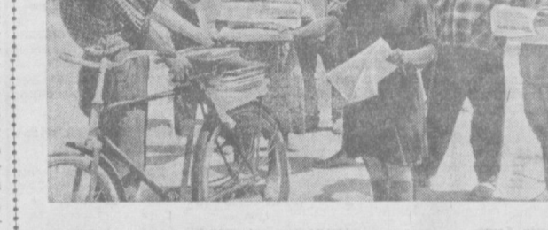
Ғуза парвариши қизғин тус олган ҳозирги кунларда Оржоникидеги райондаги «Правда» колхозининг пахтакорларига кўла маданий-мансий шартлар яратиб берилмоқда. Колхозчилар самаран меҳнатдан сўнг ишван қилиб безатилган дала шийлонларида овқатланадилар, хордиқ чиқарадилар, агитаторларнинг сўхбатини тинглайдилар. Ўзбекистон телеграф агентлиги фотомухбири Қ. Розақовнинг маъна бу икки сурати шу колхоздан олинган. Чапдаги суратда: колхоз почталёони Олим Маширабов 2-участка даласига газеталарнинг янги сонини келтириб, колхозчиларга тарқатмоқда. Ўнгдаги суратда: агитатор ўртоқ Мамуржон Олимжонов тушми дам олиш пайтида колхозчиларга газета ўқиб бермоқда.

Хар бир сўмини тежаб-тежаб сарфлаш бизлардан ниҳоятда масъулият ва маҳорат билан ишлагани талаб қилади. Хўжалигимиз асосан картошка ва сабзавот етиштиришга иқтисодлаштирилгани учун шу маҳсулотларнинг эртароқ етиштиришга ва ўз вақтида давлатга сотишга ҳаракат қилинади. Колхозимизда бу йил 290 гектар ерга эртаги ва кечки картошка экиш планлаштирилган. Пландаги 3770 тонна ўрнига 4350 тонна картошка етиштириш мажбурияти олинган. Бир центнер картошка етиштириш учун 7 сўм 50 тийин сарфлаш кўзда тутилган. Бу йил 102 гектар ерга «Седов» навали эртаги картошка уруғи экилди. Бу навал уруғ айниқса бизнинг областимиздаги колхоз ва совхозларнинг шароитида кўп ҳосил беради. Ишлов яхши бўлиб, вақтида сўтириб туришга гектаридан 180—250, қатта 300 центнергача ҳосил кўтариш мўкин. Агарда картошка эрта экилди, эрта давлатга сотилса, колхозчиларимиз катта фойда кўради. Шунинг учун ҳам биз бутун диққат эътиборини ана шунга қаратганмиз. Хўжалигимизда миришкор деҳқонлар жуда кўп. Мақам Исоев