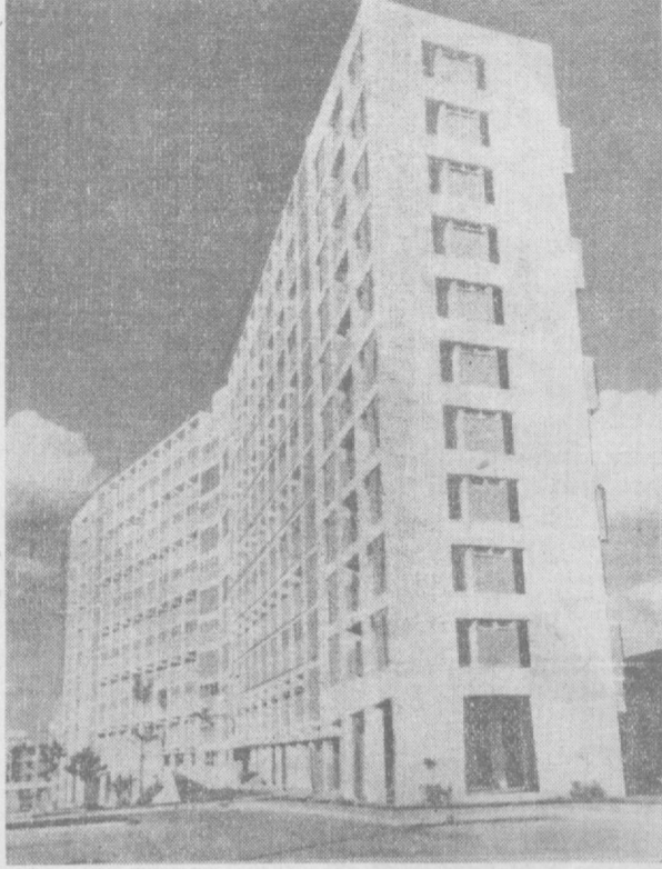
1953 йил 26 июль — КУБАДА ХАЛҚ РЕВОЛЮЦИЯСИ БОШЛАНГАН КҮН. Сиз ушбу суратда халқ ҳокимиятининг самараси — Куба республикаси пойтахти Гаванада қад кўтарган янги уй-жой корпусларини кўриб турибсиз.