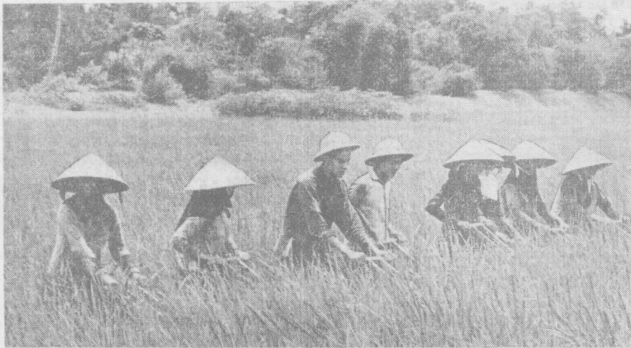
Ханойдан 35 километр узоқликда жойлашган «Нам Хонг» қишлоқ ҳўжалиги кооперативи Вьетнам Демократик Республикасининг илгор ҳўжаликларидан биридир. Кооперативда шолчи ҳосилдорлиги йилдан-йилга ўсмоқда. Бу ерда асосий қишлоқ ҳўжалиги экинидан ҳозирда 1955 йилдагига қараганда икки марта кўп ҳосил йиғиб олинмоқда. Суратда: «Нам Хонг» кооперативда шолчиоғлар ўтдан В. Соболев фотоси. (ТАСС фотохроникаси).