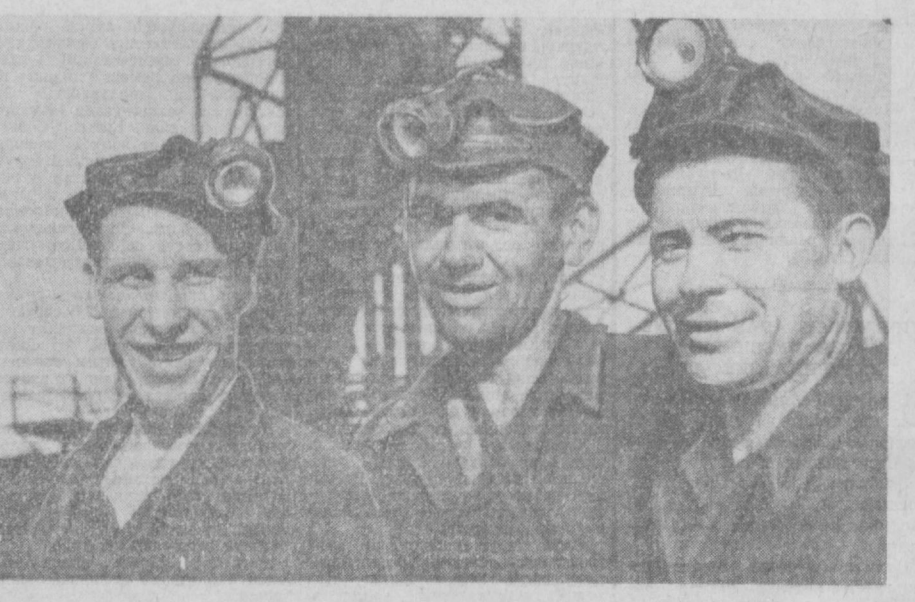
Б. ИВЛДШЕВ. 9-шахта наваллобчииси.

Т. ПАРИНОВ. кўмир разрезини коммунистик меҳнат бригадаси бошлиғи.