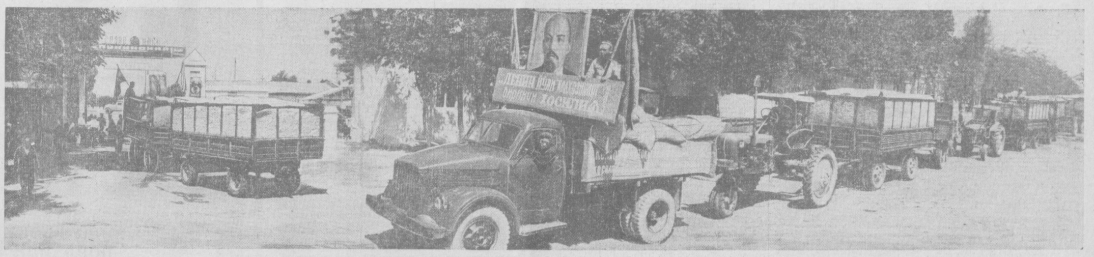
БУТУН ДУНЕ ПРОЛЕТАРЛАРИ, БИРЛАШИНГИЗ!

Кеча Бўка районининг колхоз ва совхозлари қизил карвон уюштириб, давлатга 300 тонна пахта топширдилар