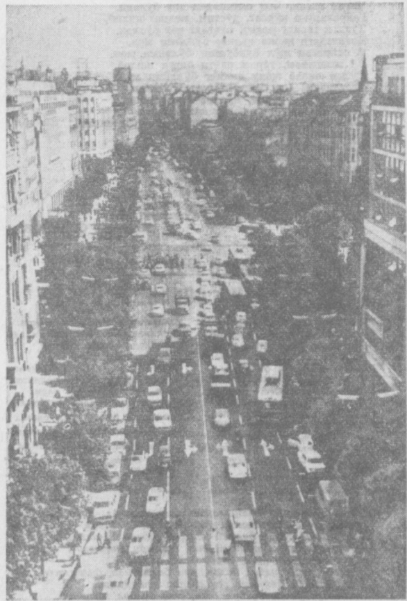
Югославия пойтахти кўчаларида машиналар тобора қўлайиб борилпти. Суратда: Белграддаги Маршал Тито номли кўчадаги ҳаракат.