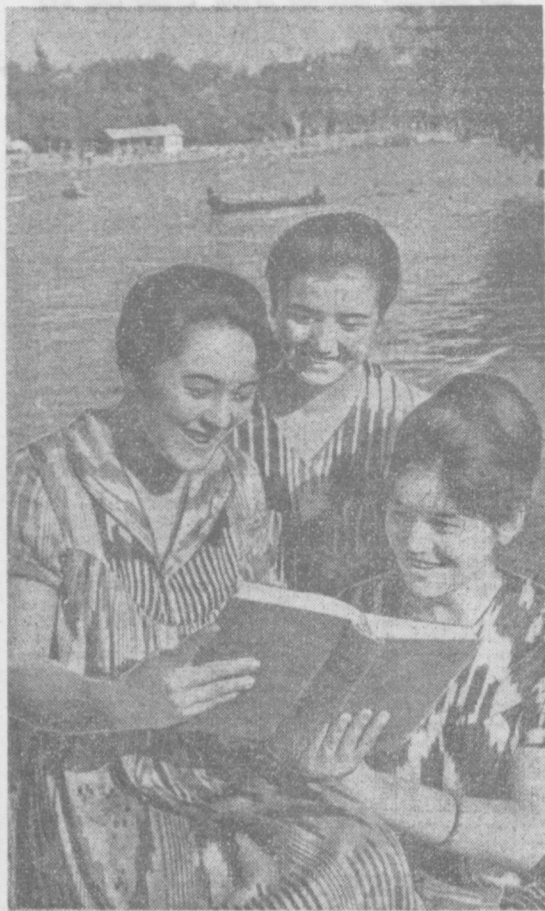
Жуда ҳам қизик қитбо эганим-а?!

Сен — булбулсан, булбулларни маст қилақол, Менинг учун сайрашгани бас қилақол, Шому сахар тичим билмай шарҳ айлақолди билангми, Қани, айтчи, булбулганим, ким тушунди тилингми? Биров сени мола деди, биров деди: оҳ-фигон... Булбул тилим булбул билар, мен билмасман; булбулжон, Анларми деб, беҳудода роз айлама қўшим, ҳай, Сен — булбулсан, булбулганим, сени булбул тушунгай, Абдулло ОРИПОВ.