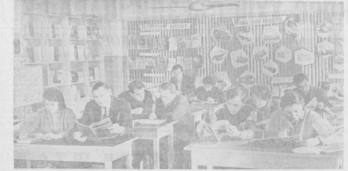
Чирчиқ «Узбекхимаши» заводининг техника ахбороти хонаси ҳамма вақт гавjum. Бу ерда фан ва техниканинг энг сўнгги ютуқлари ҳақидаги адабиётлар билан танишиш мумкин. Суратда: завод техника ахбороти хонасида.