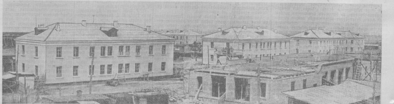
Чўл-бағрида республиканиннг энг кенжа шаҳри — Янгир-қад кўтармоқда.