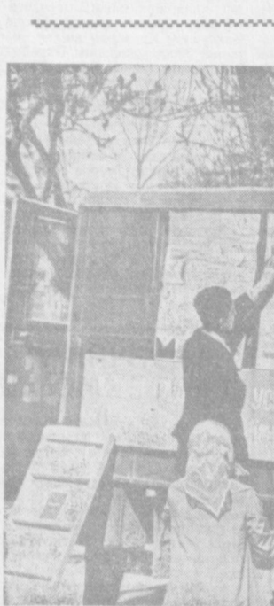
Қишлоқ клубларининг бутуниттифоқ перекличкаси

КПСС Программасида коммунист жамият курилиши кенг аж олдиндан дарда партиянинг миллий масалаларга вакифларини марксизм-ленинизм таълимоти асосида белгилаб берилиши оламшумул-тарихий аҳамиятга эга. СССР — кўнчиллатли мамлакат. СССРда тахминан юзта янги миллат ва элатлар яшайди. Бу миллий масала мамлакатимизда жуда катта аҳамиятга эга эканини ва у яна узоқ вақтгача партиянинг назарий ҳамда амалий фаолиятида муҳим ўринни эгаллашини кўрсатади.