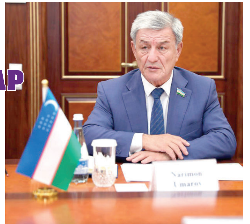
Наримон УМАРОВ, Сенатнинг Суд-ҳуқуқ масалалари ва коррупцияга қарши курашиш қўмитаси раиси

ЎЗБЕКИСТОН РЕСПУБЛИКАСИ ПРЕЗИДЕНТИ ШАВКАТ МИРЗИЁЕВНИНГ КОРРУПЦИЯГА ҚАРШИ КУРАШИШ СОҲАСИДА ЮКСАК ХАЛҚАРО МУКОФОТНИ ТОПШИРИШ МАРОСИМИДАГИ НУТҚИДАН