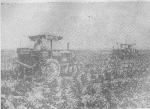
«Фарход» совхози 2-бўлимнинг ўртоқ Самат Абдурахмонов бошлик бригада ишчилари 80 гектар ернинг ҳар гектаридан 25 центнердан ҳосил етиштириш учун курашмоқдалар. Суратда: бригадада ғўзани култивация қилиш пайти.