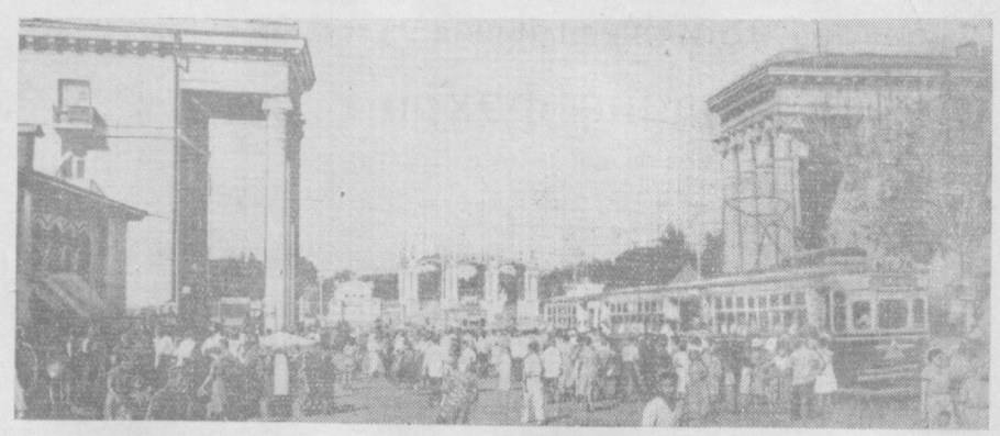
Республиканин пойтахти Тошкент йнлдан-йилга овод ва кўркам бўлиб бормоқда. Суратда: Биру-В. Надеждин фотоси.

Ташқи савдодан валюта тушумларининг камайишига, деб таъққилди газета, халқаро бозордаги тушқулик натижасидир. Уммонда жанглр ҚОҲИРА, 10 июль. (ТАСС). Уммон имомининг Қоҳиралдаги ваколатхонаси хабар беришича, Уммон ва танпарварлари инглиз босқинчиларига қарши шиддатли жанглари давом эттирмоқдалар. Жабал Алахор тор районига бўлган жангга инглиз солдатлари ва офицерларин 12 киши Улдирган. Уммоннинг миллий қаршилик кўрсатуви кучлари Маскатда инглиз нефть компаниясининг биносига ҳужум қилганлар.