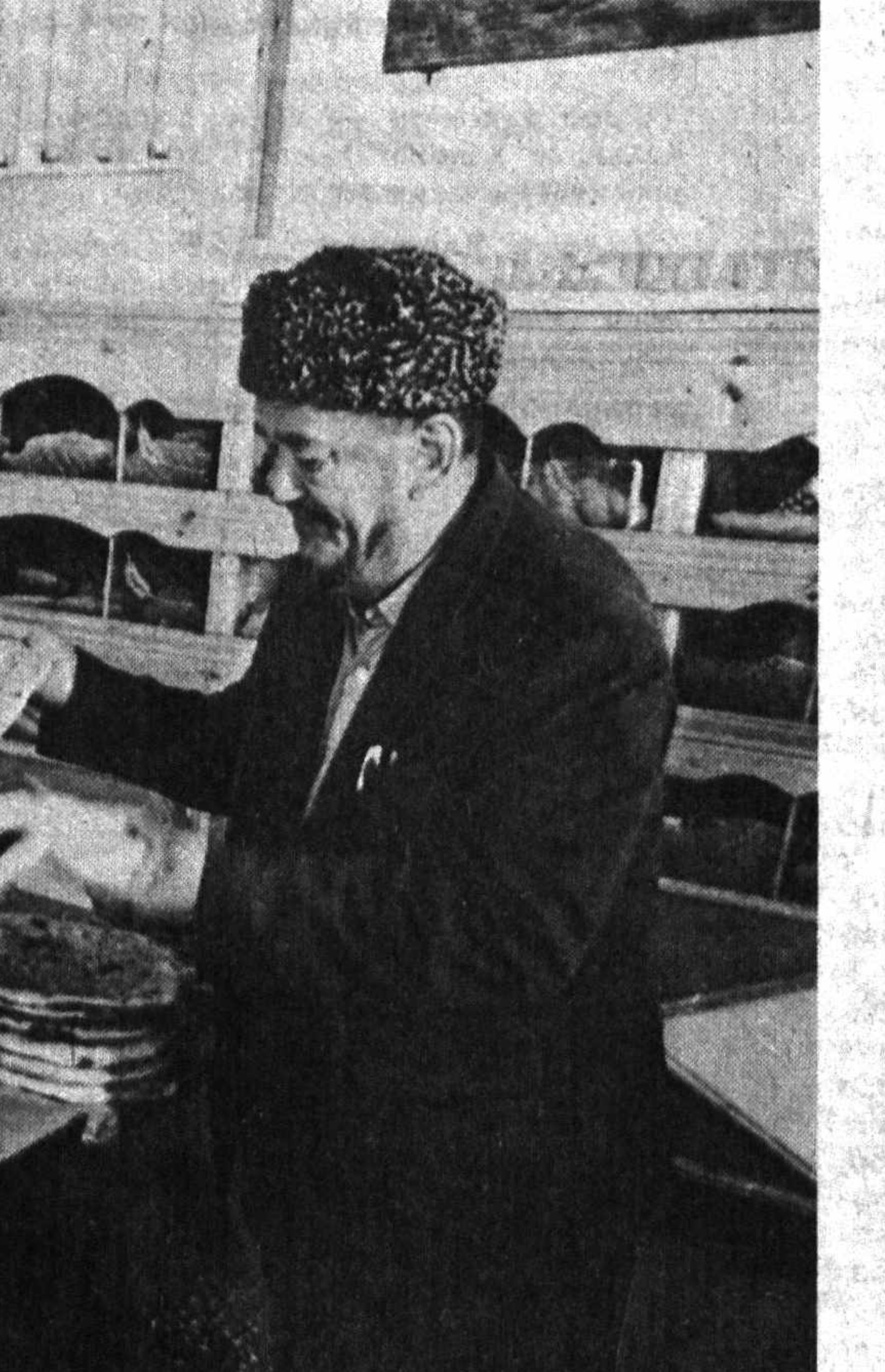
Урганч нон комбинати ишчилари қорхонани қайта жиҳозлаш аъзаига янги маҳсулот — хоразма оби нонларини ишлаб чиқаришни йўлга қўйдилар...