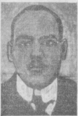
Н. В. КРИЛЕНКО.