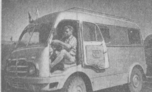
Суратда: сайёҳлар пойтахтнинг кириб келишмода.