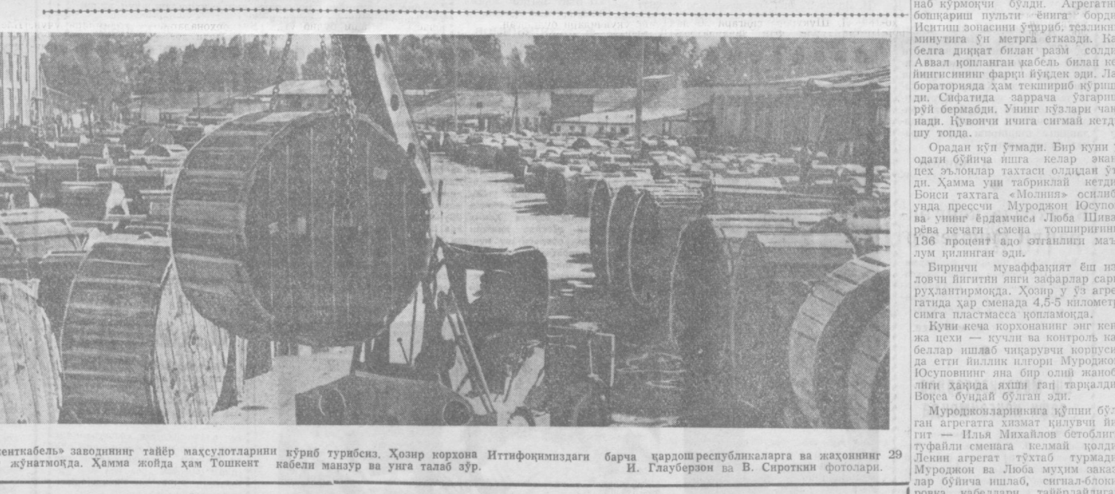
Бу суратда «Ташкенткабель» заводининг тайёр маҳсулотларини кўриб турибди. Ҳозир корхона Иттифоқимиздаги барча қардош республикаларга ва жаҳоннинг 29 мамлакатига маҳсулот жўнатмоқда. Ҳамма жойда ҳам Тошкент кабелли манзур ва унга талаб зўр.

Ун йилча ўтган яна шу кўча-дан ўтиб қолди. Уша жойини дар-ров таний олмади. Дарахтлар би-нолар билан бўйлашман дедди. Ана қайрағоч. Ерга қуюқ сон таш-лаб турибди. Остига дам оладиган уридинлар ҳам қўйилибди. Атро-фида болалар ўйнаб юришибди. Бу воқеа ўша қайрағочни яна эсимга туширди... «Ташкентка-бель» заводига ёшгина йилит иш-га келди. Маълумоти ҳам, кунари ҳам йўқ эди унинг. Шогирд туш-ди. Агрегатни бошқарди. Слесар-лик ҳам кўлидан нела бошлади. Маоши яқин, камчилиги йўқ. Ой-ла ҳам курди, фарзанд курди. Ле-кин барибир тақдир унга қўлиб боқмади. Ичкиликка ўрганди-ю боши қора кўнлардан чиқмай қол-ди. Уйда ичкани-ичган ишга ҳам ичиб келадиган одат чиқарди. Оғайнлари ҳам нойш ўрнига унинг ғуноҳини епишга уриниш-ди: ҳеч ким билмасин, йўқса бри-гадамиз шаънига ёмон гаплар бў-лади дейишди улар. Иван Панин кайфи тарқалганча ухлаб кейин секин ишга тушарди. Меҳнатни-нинг унуми ҳам йўқ, маҳсулоти-нинг сифати ҳам.