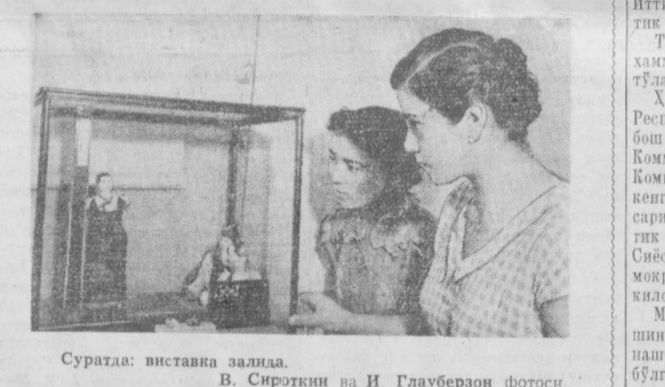
Суратда: виставка залда.

Канада бош министрининг Тайвань бўғозидаги аҳвол масаласини Бирлашган Миллатлар Ташкилотининг қароғамга тоширини ҳақида тақидлига тўхталди. Неру бундай деди: Бирлашган Миллатлар Ташкилоти ҳатто ўзи ҳам танимаган мамлакатга қандай дахл қила олмайди.