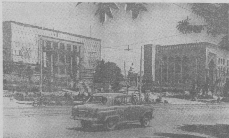
Тошкент. Суратда: Навоий проспектида.

Колумбия территориясида Рио-Винегре деб аталувчи нордон дарё бор. Бу дарё сувини шундай нордонки, унда ҳатто балнқ ҳам яшай олмайди, инсон ҳам истеъмоқ қилишни мумкин эмас.