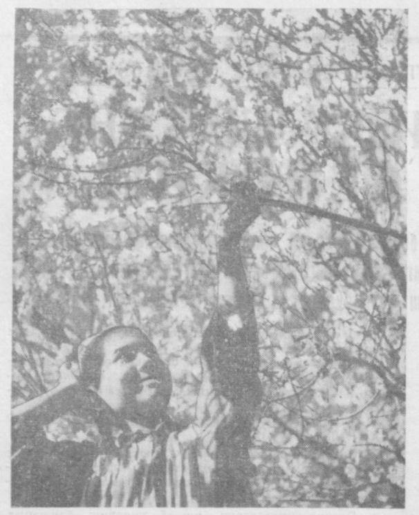
Сўлим ўлкасини гулларга, атр бўйларга бурқайдиган навбахор келди...