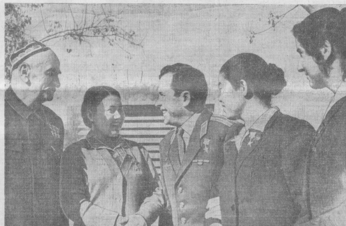
СУРАТДА: СССР носмонавт-учувчиси Павел Романович Попович (ўртада) Социалистик Меҳнат Қаҳрамонлари Ҳамроқул Турсунқулов, Турсунной Охунова, Любовь Ли ва озарбайжонлик Севиль Казиевага носмосга парвозини ҳикоя қилиб бермоқда. А. Абалиев фотоси.

Газеталарда Ўзбекистон ССР қишлоқ хўжалик меҳнаткашларининг етти йиллигининг бешинчи йили — 1963 йилда олган социалистик мажбуриятлари эълон қилинди. Унда республикаимиз, жумладан областьини қишлоқ хўжалик меҳнаткашларининг етти йиллигининг бешинчи йилида олган юксак социалистик мажбуриятлари ифодаланган. Республикаимиз пахтакорлари 1963 йилда 3 миллион 566 минг тонна «оқ олтин» етказиб беришга ваъда бердилар. Бунда областьини қишлоқ хўжалик ходимларининг ҳам катта улдуши бор. Биз бу йил Ватанга 321 минг тонна пахта етказиб бермоғимиз, ҳар гектар ердан 23,7 центнердан ҳосил кўтаришмоғимиз керак. 74 минг гектар майдонга чингит квадрат уялаб экинлади, шу жумладан 30 минг гектар майдонга чингит уяларга аниқ микдорда уруғ ташлайдиган сеялкалар билан экинлади. 107 минг тонна пахта машинада териладилар.