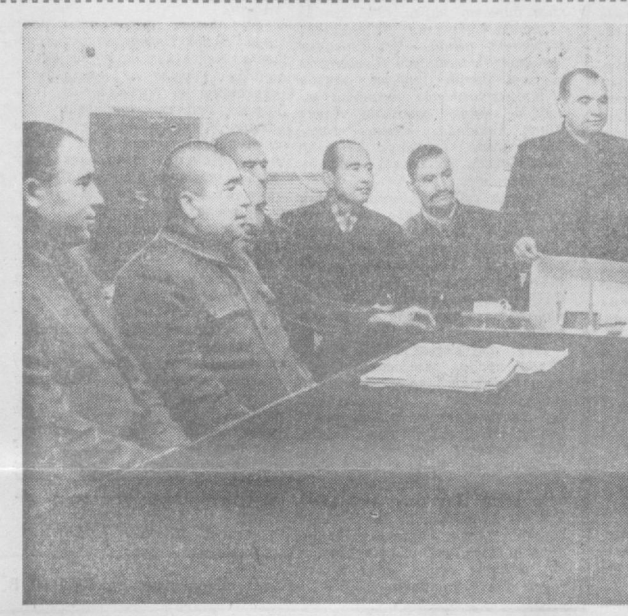
Колхоз ҳосилот кенгашининг навбатдаги бу йилгида машина теримига тайёргарлик масаласи муҳомада қилинмоқда.

Сийёс ва илмий билимлар тарқатувчи жамиятининг Ленин раёони бўлими ўзбекистон ССР Олий Совети ва маҳаллий Советларига сайловлар муносабати билан лекция пропандасини ямади жондоттириб юборди. Шу кунларда 1500 га ақик малаика лектор аҳоли ўртасида агитация-пропаганда ишлари олиб бормоқда.