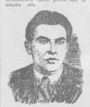
Юлиус Фучикнинг (1903-1943) бутун оғли ҳаёти курашдан иборат бўлди. У, қисқа, лекин ариқ ҳаёти даврида ўз халқининг озодлиги ва мустақиллиги учун, бутун оғлида мустақил тинчлик ва бахтли ҳаёт учун, социализм ҳақиқатининг тинч кураши ва шу улғур кураш йўлида ҳалок бўлди...

«Мангу ҳаёт» Узбек томоша бинари анчага академик театримиз — Ҳалма саҳнасидаи тушмаан шу номдаги пьесани ахши эшлади...