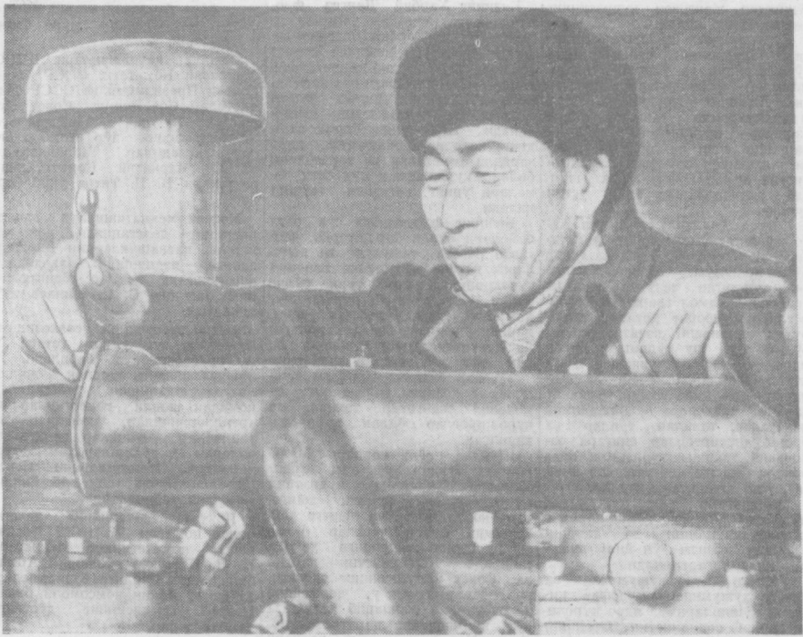
«Узельхозтехника»нинг Юқори Чирчиқ район бўлимида трактор ва бошқа қишлоқ хўжалик машиналарининг маъмурига соддадан қизил бормоқда. Суратла: Пак Дон Гвон «ДТ-54» тракторининг ремонт қилмоқда. У ҳозиргача 5 тракторини қўлдан чиқарди.