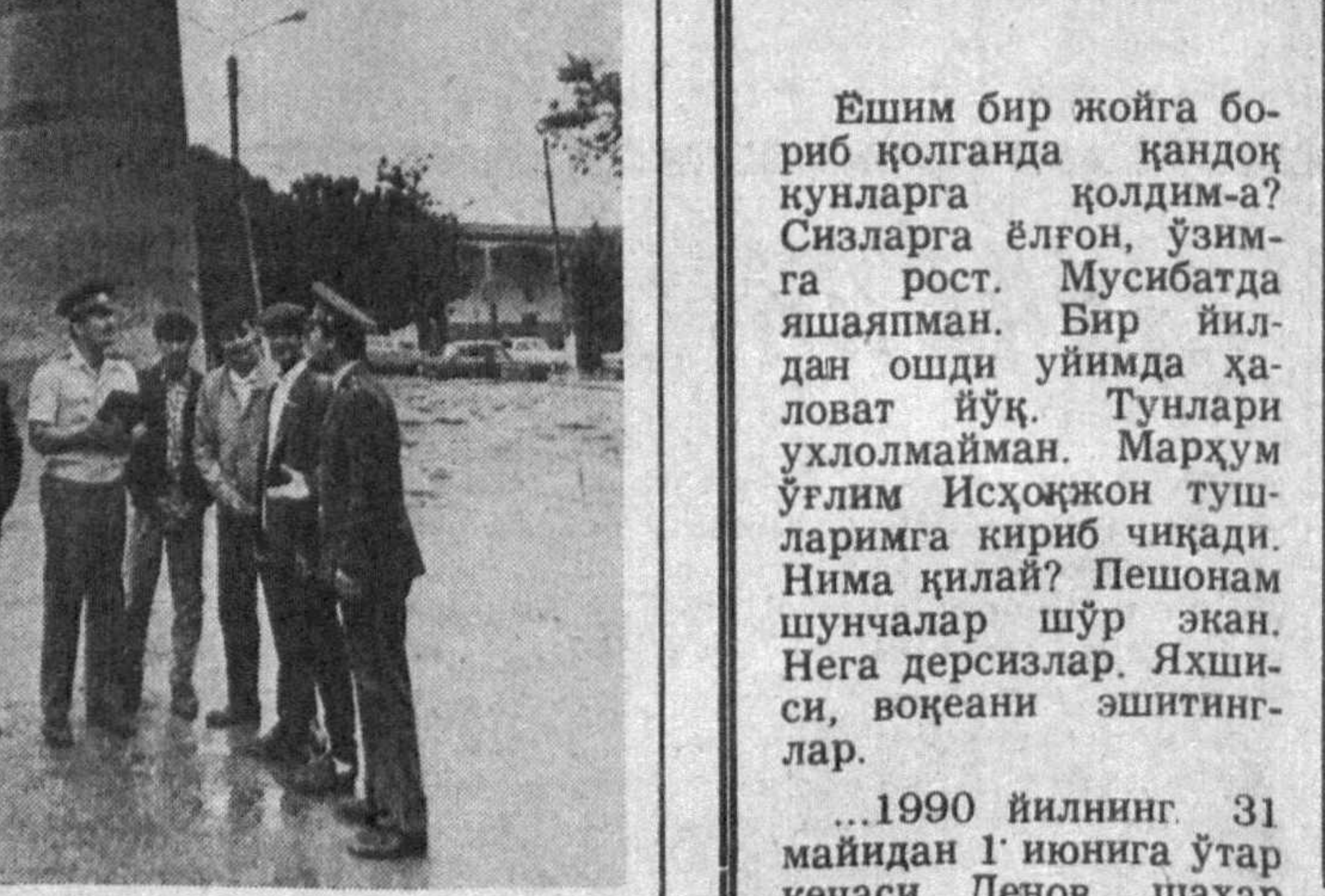
Муштарий ёрдам сўрайди

Э. ИСКАНДАРОВА, Хоразм вилояти халқ депутати, врач.