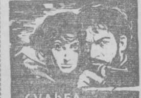
М. Жавахишвили романи асосида ишланган. Сценарий автори ва режиссёр — Х. А. Вардем. Оператор — Мишель Кельбер.

4 парда, 5 кўринишли музикали драма. Т. Жалилов ва Г. Собитов музикаси. Режиссёр — М. Миртолипов, либретёрлар — Н. М. Гиньбург, Ф. Назаров, расомлар — Ш. Шораҳимов, З. Гопнов, балетмейстер — Р. Қаримова. Спектакль кеч соат 8 да бошланади. Вилетлар сотилмоқда.