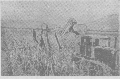
Албания Халқ Рес публикиси. Бу ерда янги ерларни ўзлаштириш юзасидан катта ишлар қилинмоқда. Беш йиллик ичюда бирнеча миң гектар ер ўзлаштирилди. Суратда: давлат фермасида маккажўхори янгиштириш пайти.

чи беш йиллик уланнинг дастлабки вариантида саноат ишлаб чиқариши 1960 йилда 1955 йилдагига қараганда ҳар йил 14 процентдан ўсиб, 92 процент ортгани, қишлоқ хўжалиги ишлаб чиқариши эса 50 процент кўнайтишни кўзда тутилган эди. Шу йил февраль ойида Албания Меҳнат партияси Марказий Комитети иккинчи беш йиллик уланнинг кўнатирилган 3 йилга (1958—1960 йиллар) қўшимчалар қабул қилди. Жумладан, 1960 йилда саноат ишлаб чиқаришини 124 процент ўстириши, қишлоқ хўжалиги маҳсулотларини 76 процент кўпроқ еттиштириши, қалитлаб маблаг сарфлаб шунинг 48 процент оширини қарор қилди. Бунинг натижасида мамлакат миллий бойлиги ялғари кўзда тутилган 55 процент ўрнига 73 процентга ошди. Беш йиллик давомда ишчиларнинг реал иш ҳақи дастлаб кўзда тутилган 25 процентдан 35 процентга, деҳқонларнинг даромадлари эса 38 процентдан 45 процентга ортади. Албания Меҳнат партияси Марказий Комитети пленумининг иккинчи беш йиллик уланга қўшимчалар киритиш ҳақидаги ташаббусларининг тўғрисида 1958 йил натижалари яққол кўрсатиб турибди.