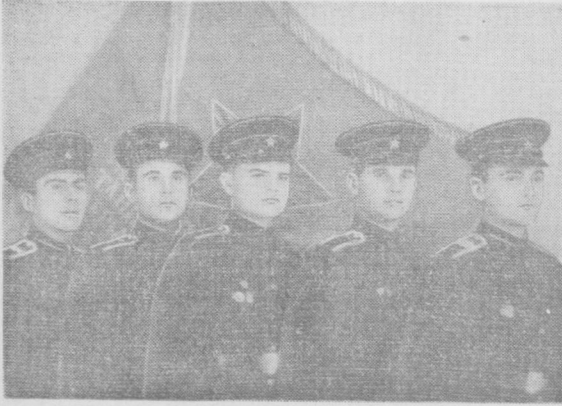
Суратда: жанговар ва сиёсий тайёргарлик аълочилири

Сталин номи Тошкент танкчилар билим юртининг ташкил этилганга 40 йил тўди. Танкчилар билим юрти 40 йил ичида шонли тарихий йўлни босиб ўтди. Билим юртининг дастлабки катта юрти Совет республикаси каттаги турбид хўма қилди. Улуғ Ватан уруши йилларида немис-фашист боксинчиларига қақшатиқ зарба берди. Билим юртида еттиб таққан баҳодир танкчилар Совет Куроли Кучлари тарихида шонли саҳифалар очди. Шунинг учун ҳам билим юрти Ленин ордени билан мукофотланди.