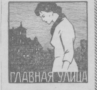
Сценарий автори ва режиссёр — Х. А. Вардем. Оператор — Мишель Кельбер.