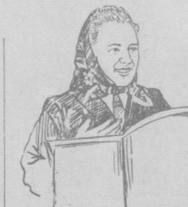
мачилик ГОСТидаги бундай камчилини бартараф қилиш учун тегишли чора кўриши зарур.

да. Бунда дастлабоқ биз, тикувчилар айбимиз. Буни инкор қилиб бўлмайди. Лекин шу нарсани ҳам айтиб ўтиш керакки, тикувчилик ГОСТи билан тўқимачилик ГОСТи ўртасида фарқ катта бўлганлиги маҳсулот сифатининг пасайишига сабаб бўлади. Тўқимачилик ГОСТида биринчи сорт билан чиқарилаётган газмолдан биринчи сортли кийим-кечак тикиб бўлмайди. Чунки бир ёки текик чипмаган газмоллар тўқимачилик ГОСТида биринчи сорта қабул қилинабери, аммо ундан тикилган кийимнинг сорти пасайиб кетади. Шунинг учун СССР Госплани тўқимачилик ГОСТидаги бундай камчилини бартараф қилиш учун тегишли чора кўриши зарур.