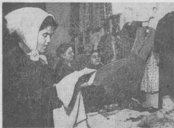
Суратда: маданият уйининг чеварлари тинчан нийимлар виставна, сина.