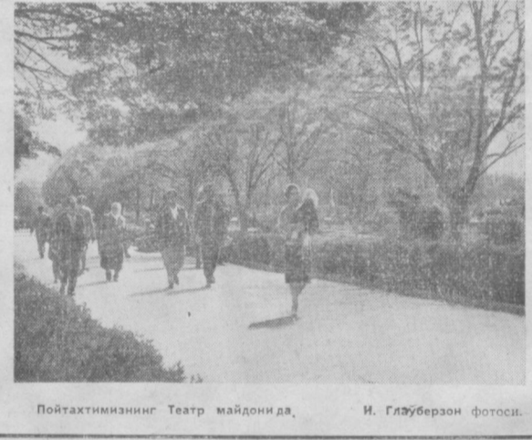
Пойтахтимизнинг Театр майдонида, И. Глүберзон фотоси.