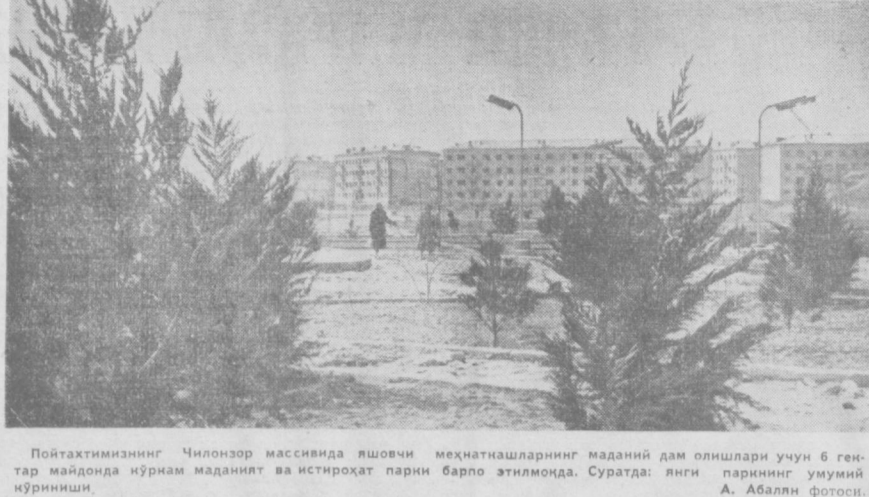
Пойтахтимизнинг Чилонзор массивида яшовчи меҳнатнашларнинг маданият дам олишлари учун 6 гек-тар майдонда кўрнам маданият ва истироҳат паркни барпо этилмоқда. Суратда: янги паркиннг умумий кўрнинида.