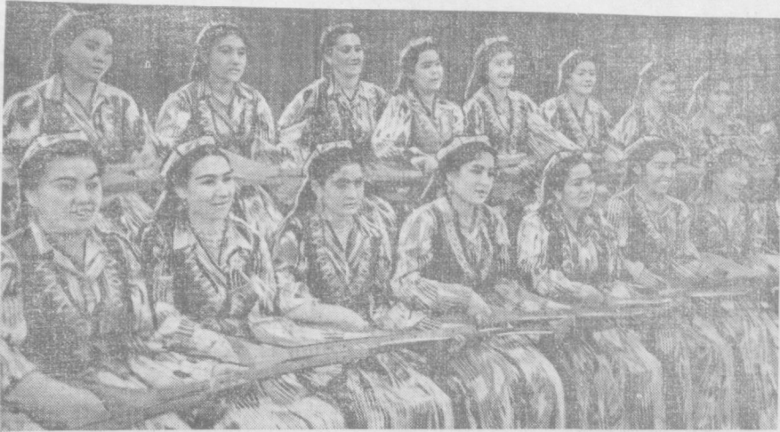
Ўзбекистон Давлат филармониясининг ўзбек ашула ва ракс ансамбли республикада хизмат кўрсатган артист Х. Нишонов раҳбарлигида Москвага бўладиган ўзбек адабиёти ва санъати декадасига янги программа тайёрлаётди.