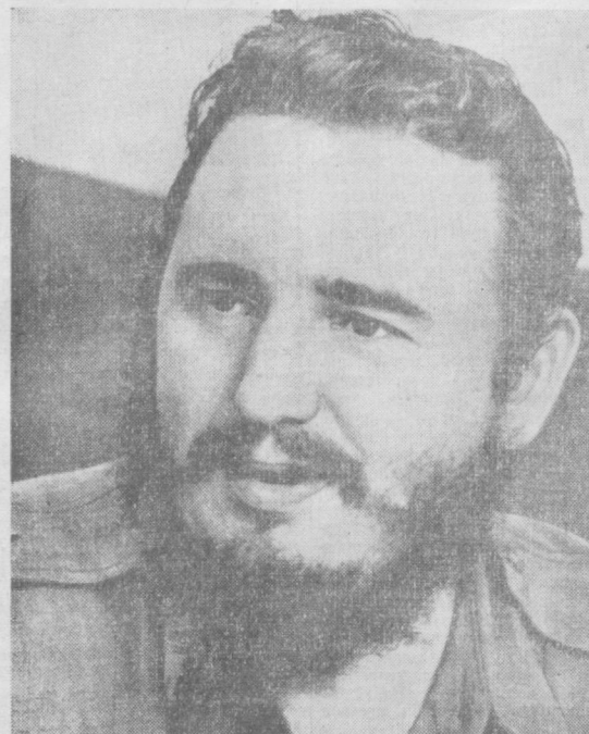
ФИДЕЛЬ КАСТРО РУС