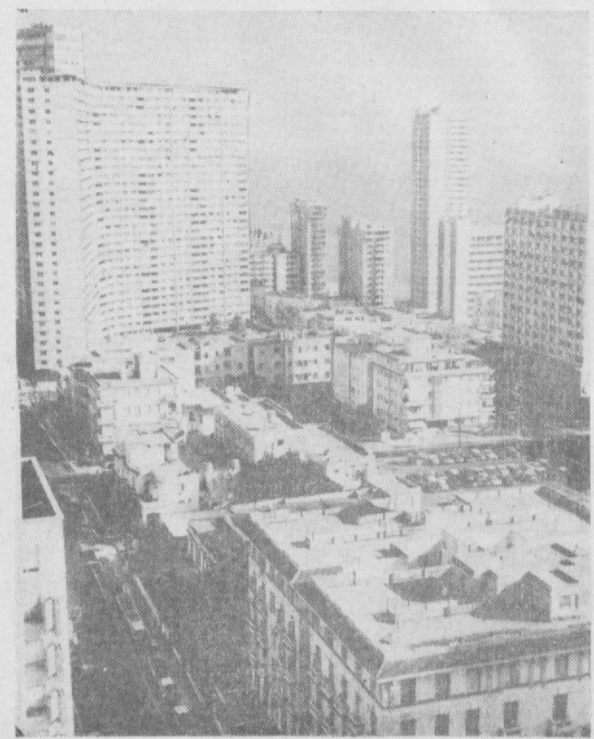
Суратда Куба Республикасининг пойтахти Гавана.