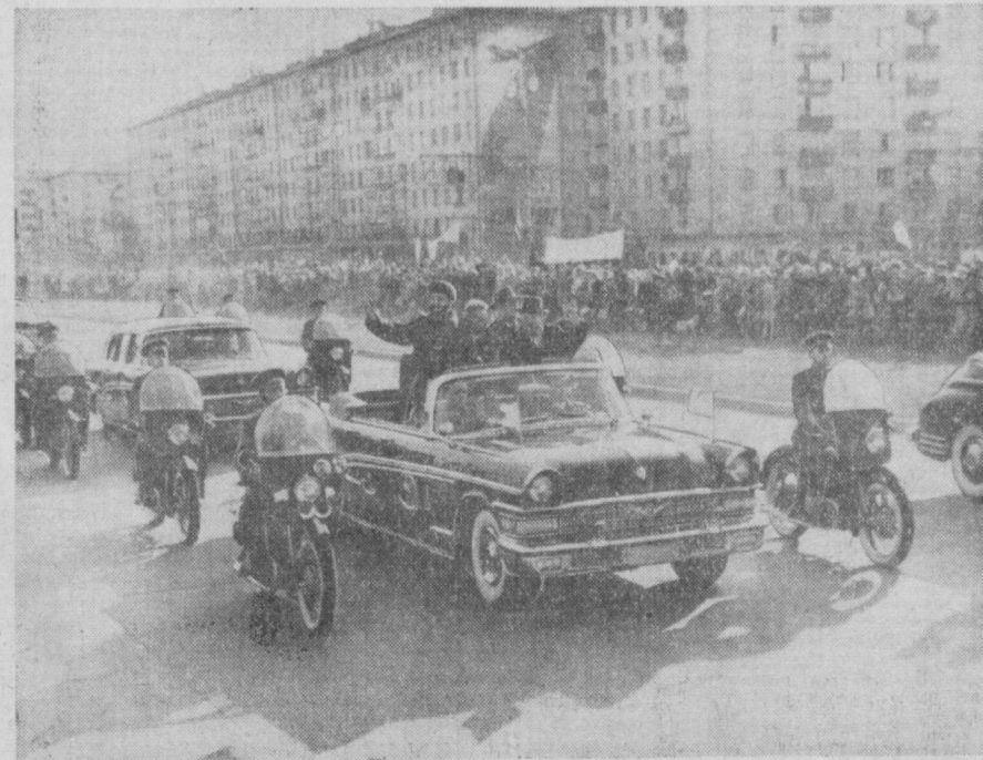
Социалистик революция Бирлашган партияси Миллий раҳбарлигининг биринчи секретари, Куба Республикаси революцион ҳукуматининг бош министри Фидель Кастро Руснинг Москвага келиши. Суратда: Ленин проспектидан ўтиб бориш вақти.

Фидель Кастро ва Н. С. Хрушчев майдоннинг ҳамма томонидан эшитилаётган қизгин табриқларга қўлларини қўтариб жавоб қилдилар. Кичикнинг мосвақиллик — пионерлар кубалик дўстлар ва совет раҳбарлари олдида югуриб келадилар. Фидель Кастро ўзига биринчи бўлиб гулдаста топириб, унинг болаинг бошини эриклаб сийлади. У ўзининг кўнрақига пионер анагонини тақиб қўйган қизчага ташаккур айтди. Орадан бир дақиқа ҳам ўтмай, ҳурматли меҳмоннинг қўли қўчоқ-қўчоқ, ранг-баранг баҳор гуллари билан тўлиб кетди. Олдиқлар тўхтовсиз давом этмоқда. Қарсақлар ва хитоблар тўқниши орасида одатдан ташқари овозлар ҳам эшитилди: бу Куба миллий чолғу асбобларининг товуши, Москва олий йилча секретари Эмилио Арагонес Наварро, Социалистик революция Бирлашган партияси Миллий раҳбарлигининг аъзоси, Куба революцион қуроли кучлар министрининг ўринбосари Серхио дель Валье Хименес, Социалистик революция Бирлашган партияси