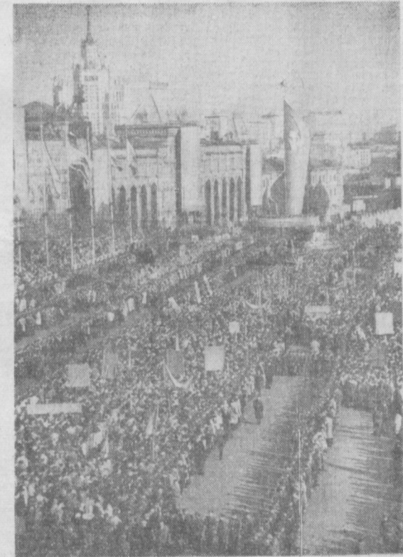
Москва, 28 апрель 1963 йил. Социалистик революция Бирлашган партияси Миллий раҳбарлигининг биринчи секретари, Куба Республикаси революцион ҳукуматининг бош министри Фидель Кастро Руснинг Совет Иттифоқига келиши муносабати билан Қизил майдонда ўтказилган митинг.

Кастро Н. С. Хрушчевни кучоқлаб олди, Л. И. Брежневга қўл бериб қўришди. Бу — дўстларнинг самимий кучоқлашуви, қадронларнинг кучоқлашуви... Самовий биродорлар Ю. Гагарин ва А. Николов Фидель билан саломлашдилар. Фидель уларга табасум билан қарайди. А. И. Микоян ва Фидель Кастро Мунманскда кутиб олган бошқа совет давлат арбоблари ҳам шу ерда.