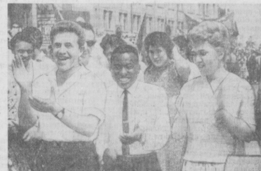
Халқлар бири-бирига дўст, биродар, ҳамдам...