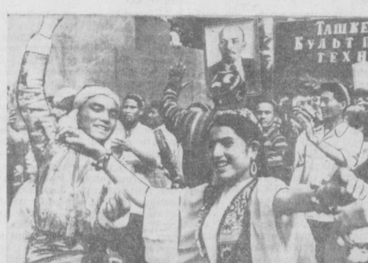
Халқимизнинг ўзайди чиройли ўйинлар...

«Умумхалқ социалистик мусобақасини кенгайтириш!» Етти