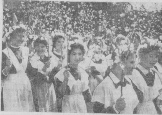
Бизнинг илажагимиз — болаларимиз...

Иллик бешинчи йили планини муддатидан илгари бажарилиши — КПСС Марказий Комитети Биринчи май Чақириқларининг ана шу сўзлари минбардан янграб экан. Тошкент тўқимачилик комбинати кўп миғ кишини коллективнинг вақиллари бу сўзларини кўнгиладан қўлаб-қувватлайдилар. Комбинатда етти йиллик бошлангандан бери пиландан ташқари 15 миллион метр газлама ишлаб чиқарилиди. «Ташсельмаш» машинасоалари ҳам улғурдан қўчилаётганлар. Мамлакат тўқимачилик сановати учун ускуналар ишлаб чиқариш планини муддатидан илгари бажариш бу қорхона коллективи учун қўнун бўлиб қолди.