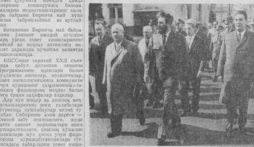
Москва, 1963 йил 1 Май. Коммунист партия ва Совет ҳўкумати раҳбарлари, кубалик ўртоқлар Қизил майдон сари бормоқда. Олдидан Н. С. Хрушчев, Фидель Кастро, Л. И. Брежнев, А. Н. Косигин ўртоқлар.

қандай уришилларга кескин зарба бермоқда. Жонакон Коммунист партия ва унинг ленинчи Марказий Комитети теварағида маҳкам жинслашган совет халқи келажакка зўр ишонч билан қарайди, коммунизмнинг нурафшон чўққилари сари шаддам қадамлар билан бормоқда. (Давоми 2-бетда).