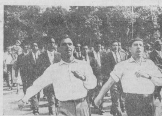
Кубалинлар саф тортиб ўтишди...