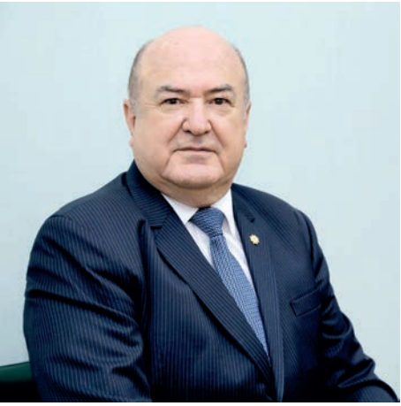
Каландар Абдурахманов. Академик.