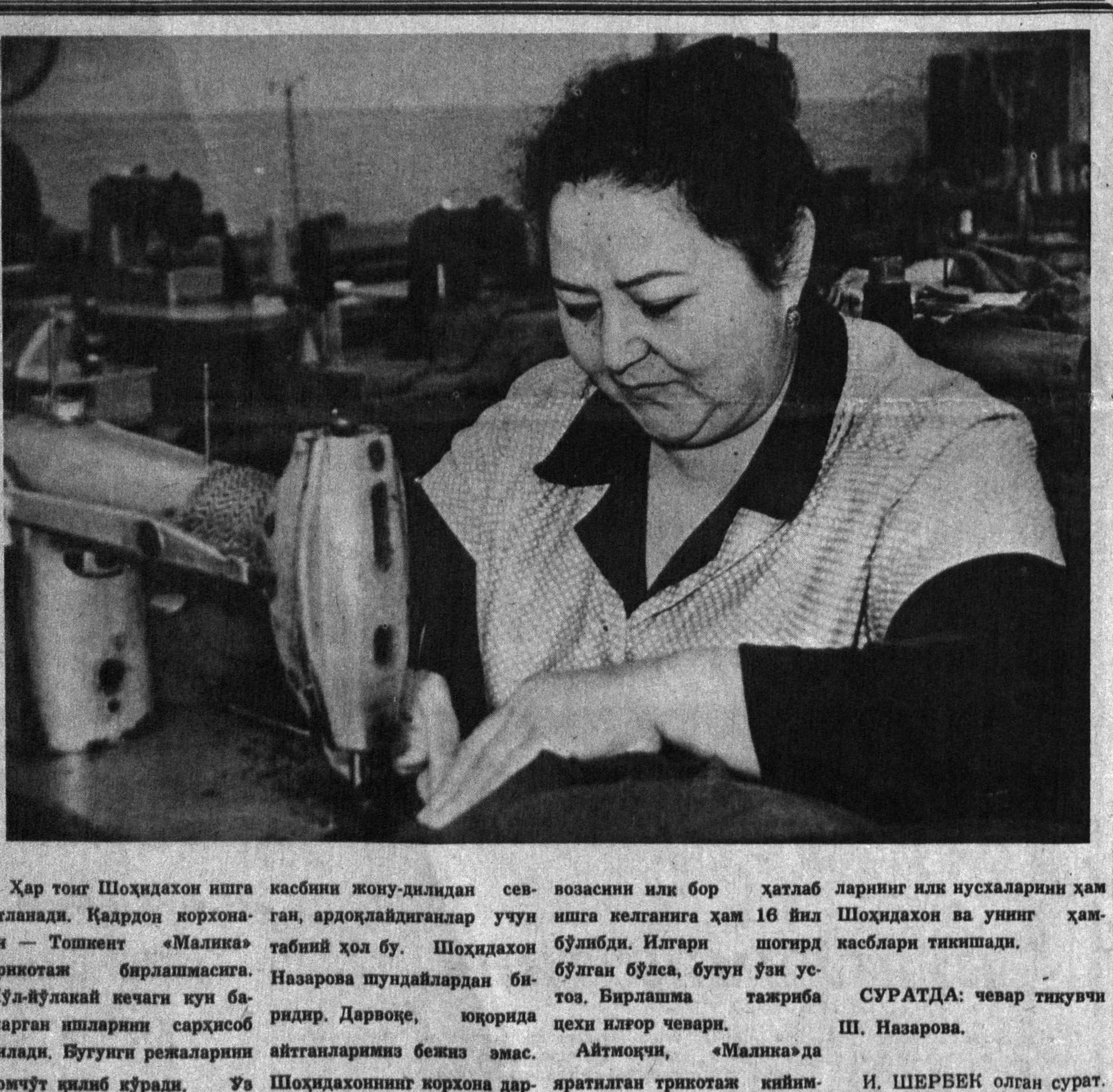
Ҳар тонг Шоҳидахон ишга оқланади. Қадрон корхонаси — Тошкент «Малика» трикотаж бирлашмасига. Йўл-йўлакка кечаги кун ба-жарган ишларини сарҳисоб қилади. Бугунги режаларини хомчўт қилиб кўради. Ҳа

1988 йилгача давом этди. — Мен сизнинг фикрингизга қўшилман, Лекин бунинг Рашидов муаммосига қандай алоқаси бор? — Нима бевосита алоқаси бор. Пахта билан боғлиқ 24 мингта жинорий иш қўзғатилганда, ҳақиқий жи-ноятчилар билан бирга уларнинг қўрбонлари ҳам бараварига қамоққа олинди. Бизнинг раҳбарларимиз эса Москвага пахта плани ба-жарилиши қандай бораётганлиги тўғрисида ҳисоб бер-гандай шунча минг киши ҳисобга олинди, шунча-шун-часи партиядан ўчирилди, мазмунда мунтазам равиш-да ахборот бериб турдилар.