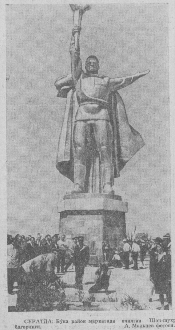
СУРАТДА: Бўна район марказида оцилган Шон-шухрат ёдгорлиги.

Район маркази Ғалаба кунини — 9 майда байрамдагидек беақаларга бўлишди. Соат 10. Ўзбекистон Компартияси Марказий Комитетининг бюросининг аъзоси, Қўчиқ Байроқчи Туркистон ҳарбий округининг қўмондонини генерал-полковник С. Е. Белоножко фахрий қорувли бошлиғи рапортини қабул қилди.