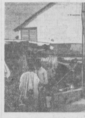
Афғонистон мустақиллигининг 44 йиллигига

Газетада Н. С. Хрушчевнинг ўз кўнчилигида агар АҚШ Кубага ҳужум қиламасди ҳақидоги афдаларини бугундан бўлса, жаҳон ўган айлоабдан куба каттароқ ҳаф оғида қўлади, дебам сўзларини ўқтириб чиқариблар.