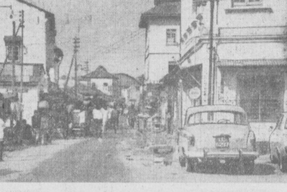
Афғонистон мустақиллигининг 44 йиллигига