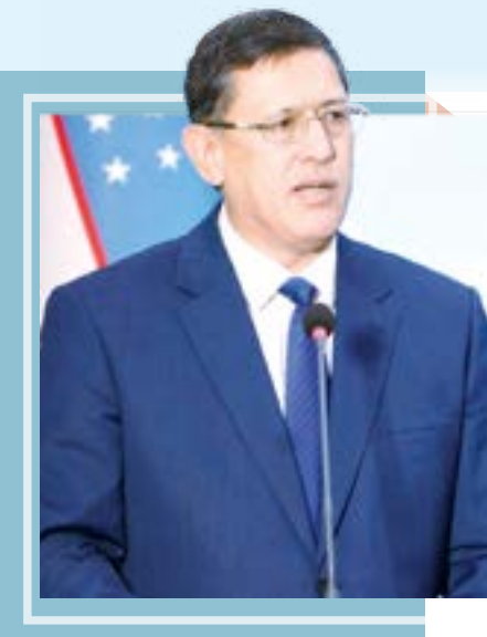
Минҳожиддин МИРЗО, Республика Маънавият ва маърифат маркази раҳбари

Шавкат МИРЗИЁЕВ, Ўзбекистон Республикаси Президенти