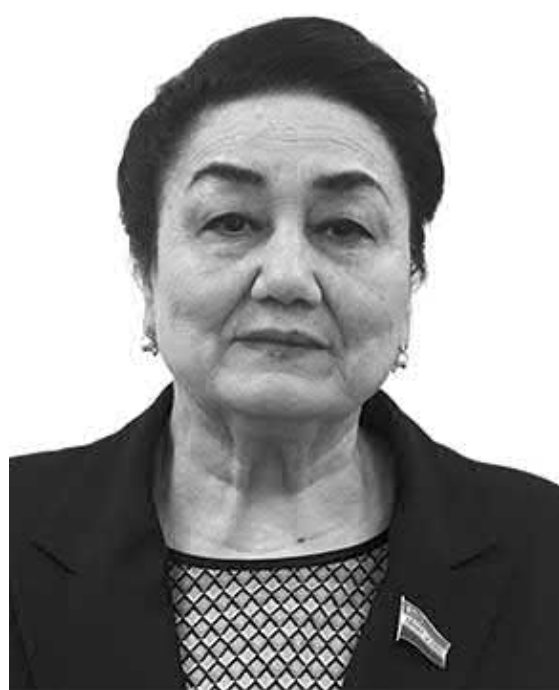
Гулистон АННАҚИЛИЧЕВА, Олий Мажлис Сенати аъзоси, Қорақалпоғистон халқ шоири.

2024 йил мамлакатимизда "Ёшлар ва бизнесни мизга йўллаган Янги йил табригидаги ният, ғоя ва Депутатлар, ҳудудий партия ташкилотлари етакчилари,