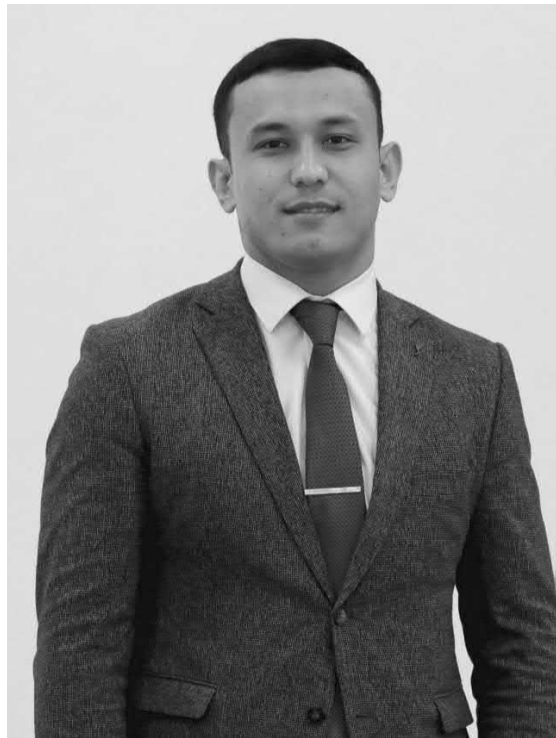
Нурмурод СИРОЖОВ, Олий Мажлис Қонунчилик палатасидаги Ёшлар парламенти аъзоси.

Ишончим комилки, янги йилда ҳам иқтисодиётимизга хорижий инвестицияларни жалб этиш, тадбиркорлик ва хусусий мулк учун кенг имкониятлар яратиш, илм-фан, инновация, IT каби соҳаларни ривожлантиришга алоҳида эътибор қаратилади.