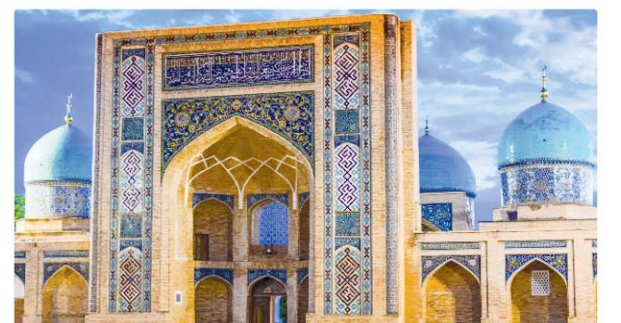
While big, well-known tourist attractions continue to shine on tourist maps, offbeat and lesser-known destinations are also making the right impact. The past few years have seen an unexpected increase in fondness for places that were closed for mass tourism. The inquisitiveness for the people and culture of virgin destinations is worth an adventure.

Why are Indians travelling to Uzbekistan?