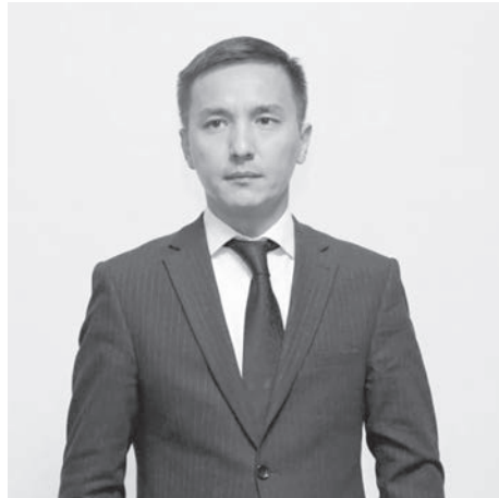
Маманбий Омаров. Первый заместитель министра транспорта Республики Узбекистан.