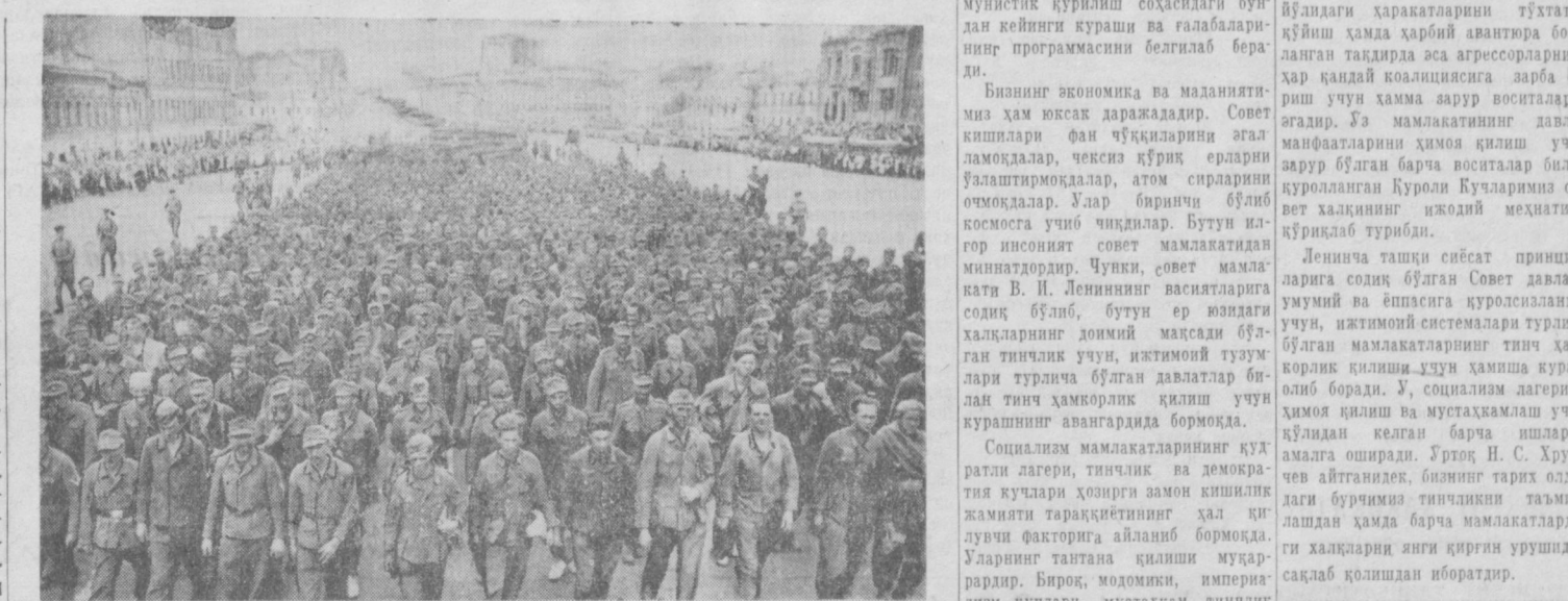
1944 йил 17 июлда немис оқдиги солдат ва офицерлар соста илдан иборат 57600 ҳарбий асирлар Москва орқали ҳарбий асирлар лагерига олиб ўтилган эди. Бу асирлар Қизил Армия қўшинлари томонидан 1, 2 ва 3 Белорусия фронтлари урушининг кейинги вақтларида қўлга олинди. Суратда: немис ҳарбий асирлар колоннаси Садовое кўлоьда. ТАСС фотохроникаси.

Тўртта комплекс ремонтчилар бригадаси ташкил қилинди. Ремонт суръатини тезлатиш ва иш сифатини яхшилаш мақсадида ремонт участкаларига мутахассислар юборилди. Ремонт ишларини бажарувчилар ўртасида иш таъсироти қайта кўриб чиқилди. Таъминот бўлимининг бошлиғи ўртоқ Арутюнянга пунктларни биринчи навбатда транспорт ва қурилиш материаллари билан таъминлаш вазифаси топширилди. Сабаваот қабул қилиш пунктларининг ремонтини белгиланган мўддатда тамомлашни таъмин қилмагани, қурилиш-монтаж бошқармасининг йиғилишларида «ишлар жойида» деб алдаб, кўбўямачилик қилгани учун участка бошлиғи ўртоқ В. Г. Марнер вазифасидан бўшатилади. Тошкент шаҳар ижроия комитетини савдо бошқармаси СМУнинг бошқармасида ишчи Е. ЛУНИЧЕВ.