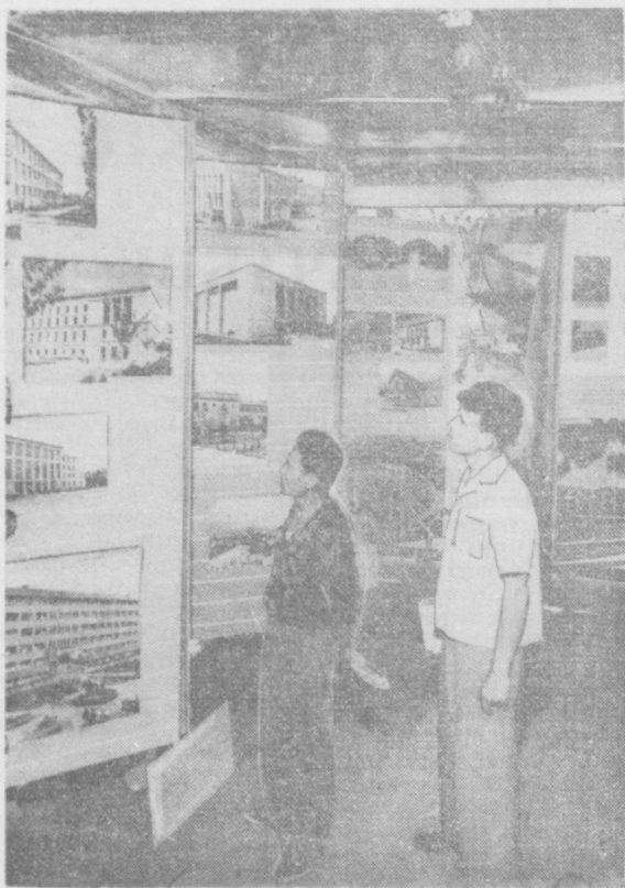
Пойтахтимизнинг Округ офицерлар уйи паркида очилган «Руминия халқ ҳўжалиги қўрилмалари» выставкасида. Суратда: тамошанилар выставка стендлари олдида.

Курс машғулотлари Тошкент тўқимачилик институтининг малакали ўқитувчилари томонидан ўтказилмоқда. Р. АМИНОВ.