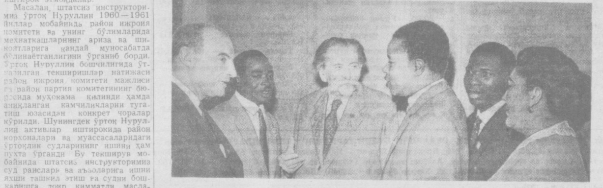
Суратда: медикларнинг халқаро форуми қатнашчиларидан бир гуруҳи.