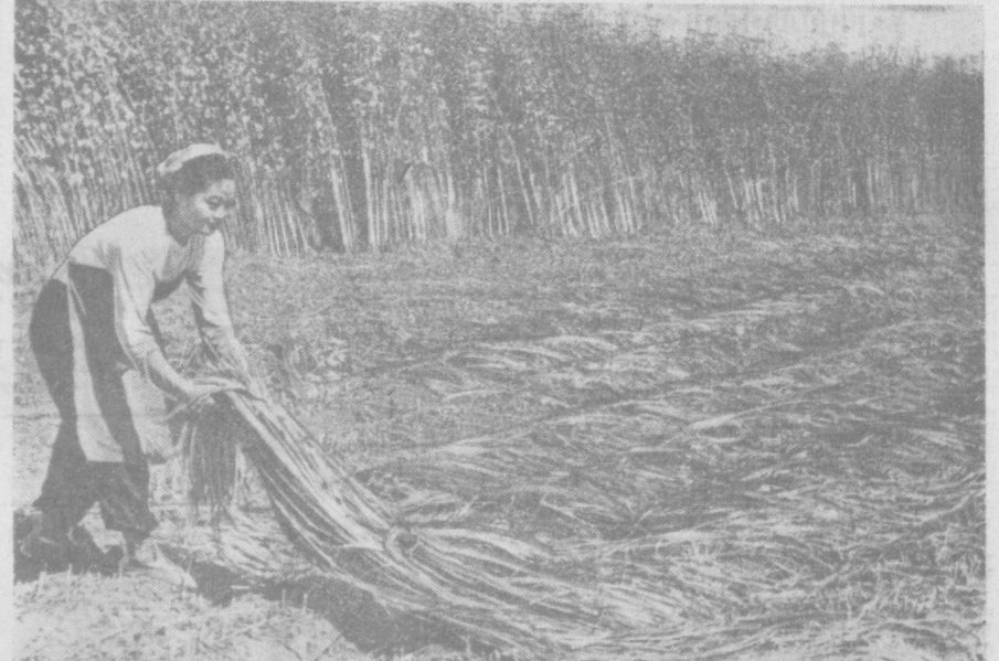
Юқори Чирчиқ районидан Свердлов номли қолқоғда қаноп ўрими қизини бормоқда. Кишлоқ хўжалик артелининг дубкорлари партия XXII съезди шарафига 1776 гектар ернинг ҳар гектаридан 173 центнердан қаноп топшириш планини 110 процент ба жаришга аҳд қилганлар. Коммунист Георгий Пак бошчилик қилаётган бригада коллективни мусобақадорлар орасида олдинда бормоқда. Унинг бригадаси ҳар гектар ердан 215 центнердан қаноп олмақда. Бу энг юқори кўрсаткичдир. Бригада аъзолари қолғон ҳосилни тез суръатлар билан ўриб олмақлар. Суратда: илгор қолқоғчи, комсомол аъзоси Алла Пак шиланган луб полярини кўриштириш учун ёймоқда.

Э. ГАНИЕВА, Янгийўл районидан «Коммунизм» колхозининг механик-ҳайдовчиси.