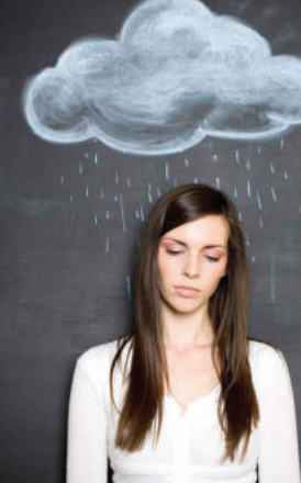
Финляндиянинг Хельсинки университетидаги бир гуруҳ олимлар атроф-муҳитнинг ҳамда ирсий ўзига хосликнинг одамлар руҳиятига таъсирини ўргандилар. Бу ҳақда Nature Mental Health илмий журнали хабар қилади.

Мутахассислар кейинги пайтларда Фарбий Европа мамлакатлари фуқароларида тушкунлик, депрессия кўчайиб бораётганлигини, ўз тадқиқотларида бунинг сабабини ўрганишга интилганлигини таъкидлаб ўтишган.