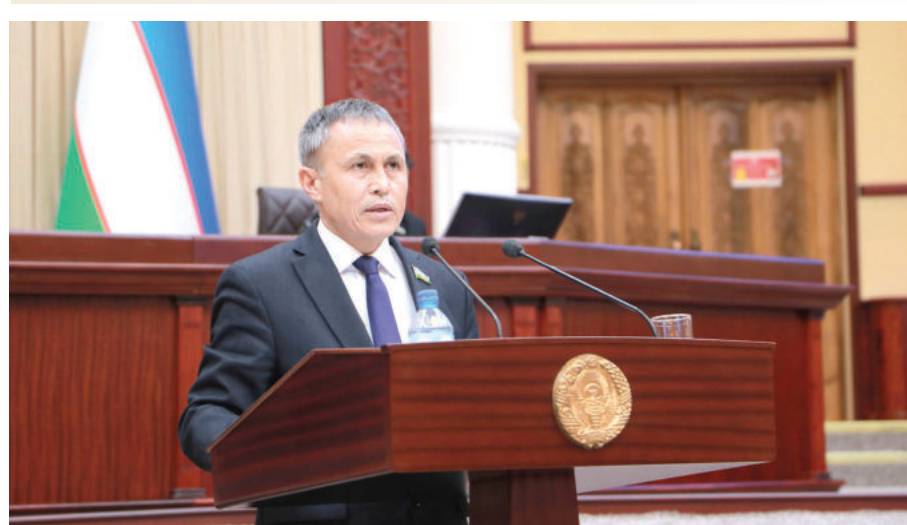
Абдуғани УМИРОВ, Олий Мажлис Қонунчилик палатасидаги «Адолат» СДП фракцияси аъзоси

Жаҳон иқтисодиётида кечаётган беқарор вазият, мамлакатлар бир-бирига нисбатан қўллаётган иқтисодий санкциялар билан боғлиқ хатарлар, ҳар хил молиявий ва бошқа чекловлар нафақат шу мамлакатлар, балки қўшни давлатлар иқтисодига ҳам ўз таъсирини кўрсатмоқда.