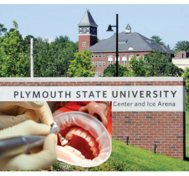
Англиядаги Плимут университети биологлари тиш ўсиш жараёнини тиклашга муваффақ бўлдилар. Олимлар нима учун кўплаб жониворларда тишлар бир умр ўсиб туриши, одамларда эса болалик даврдан кейин тўхтаб қолиши сабабларини аниқлашди. Бу янгиликни тадқиқот гуруҳи раҳбари Жос Стюарт Nature