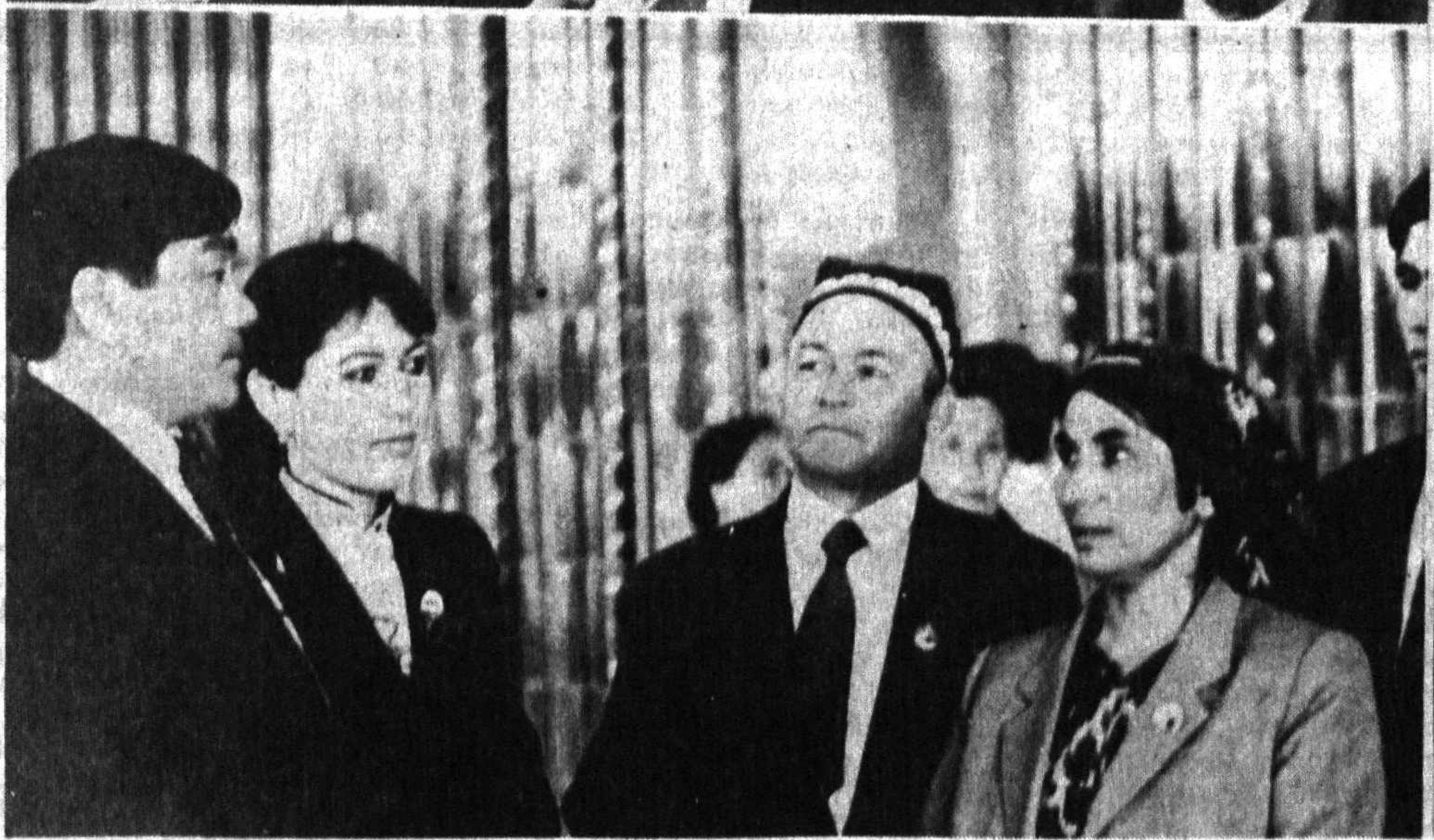
Ўзбекистон деҳқончилик саноати илгорларининг қурултойида.