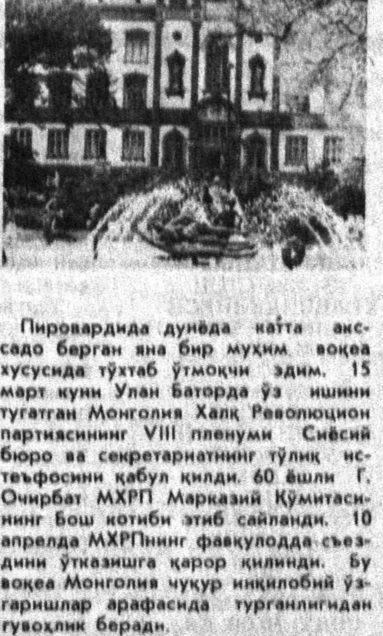
СУРАТДА: дорилфунунининг бosh корпуси.

бошқа министрлар ҳам истеъфога чиқандиларини маълум қилдилар. Энди Исроилда тузилмадан янги ҳукумат — ҳоҳ у турли партиязла-рининг қайта келишувидан, ҳоҳ парла-ментга янги сайловлар ўтказишдан вужудга келсин, Фаластин муаммо-си қўндаланг бўлиб тураверди. Фа-ластинлик арабларнинг қонуний ҳу-қуқларини тан олмади туриб, Фалас-тин Озоқлик Ташкилоти вакиллари билан бақамти мунозаралар олиб бормай туриб Яқин Шарқ муаммоси-ни ҳал этиш бўлмайди. Бу муаммо мажмур минтақада барқарор тиқчи-лини таъминлаш йўлидаги асосий го-вдир. Исроил ҳукмрон доираларида янги фикрлашнинг пайдо бўлгани ўзгаришлар шамолнинг у ерга ҳам етиб берганидан дарак бермоқда. Демак Яқин Шарқдаги ҳурурлик ва беқарорликнинг барҳам толишига умид қилишга ҳақимиз.