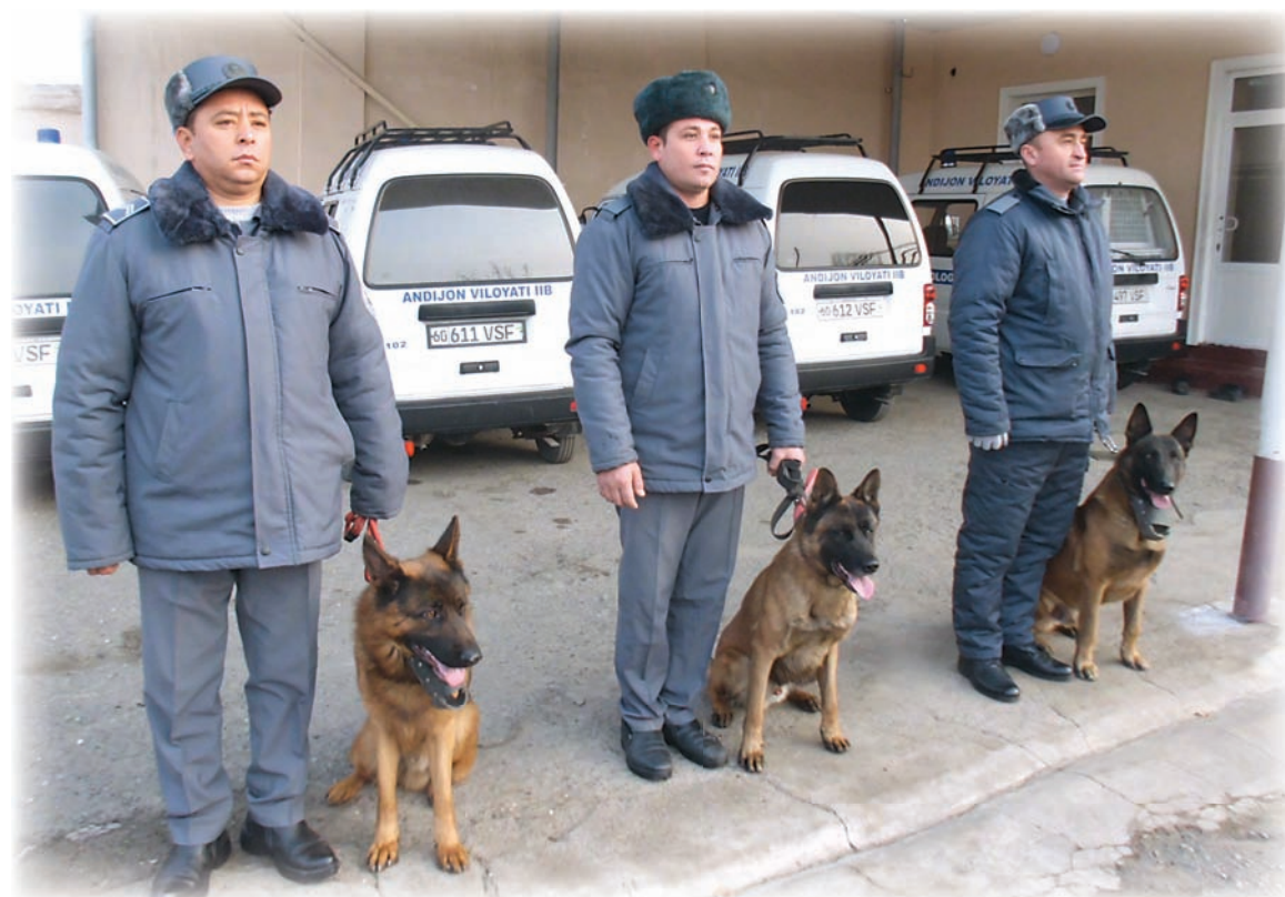
Инструкторы-кинологи перед выездом на задание.

ковой пленкой. По заключению специальной экспертизы содержимое свертка состояло из марихуаны общим весом 104 грамма.