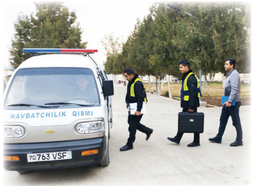
Tergov-tezkor guruhi voqea joyiga otlanmoqda.

baholanadi. Tumandagi 1-sonli huquq-tartibot maskani «Mirishkor», «Yangi Mirishkor», «Oqmachit», «Zafar» va «Guliston» mahallalarida istiqomat qiluvchi 19 ming nafardan ortiq aholiga xizmat ko'rsatadi. Mazkur huquq-tartibot maskani ish boshlagandan buyon 853 nafar fuqaro turli masalalarda murojaat bilan keldi. Ularning murojaatlari atroflicha o'rganib chiqilib, aksariyati joyida hal etildi. 109 ta holat bo'yicha huquqiy tushuntirish berilgan bo'lsa, 23 ta holat bo'yicha to'plangan hujjatlar kelgusida qonuniy to'xtamga kelish uchun tergov organlariga yuborildi.