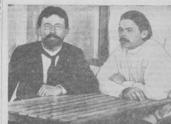
Суратда: А. П. Чехов билан А. М. Горький Ялтада.