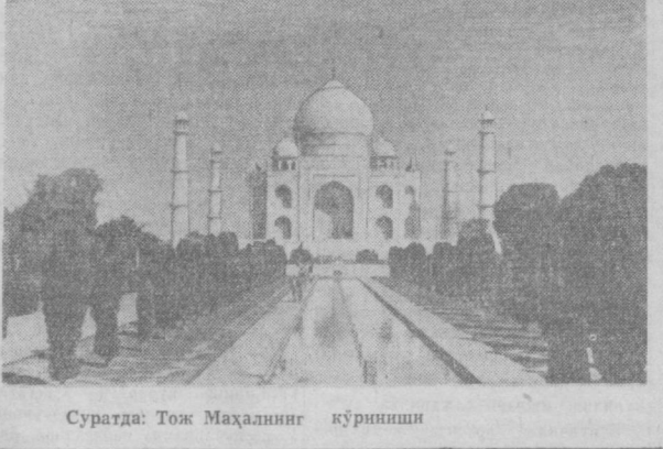
Суратда: Тож Маҳалнинг қўриғини