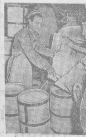
Тошкент элек-бўёқ заводи шу етти йилликда лак ва бўёқларнинг янги хилларини ишлаб чиқара бошлайди.